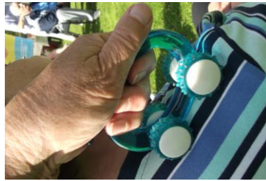
Liikuntatapahtumassa Hevossalmessa 06.08. Venyttelyä, hierontaa ja mukavaa yhdessäoloa.