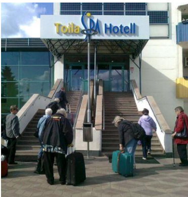
Toila Spa 15.-22.05.