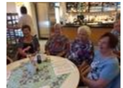
Lehmirannan tunnelmissa 09.-15.08.